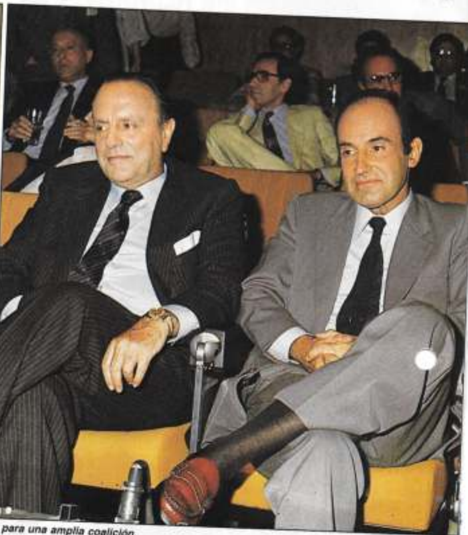
Suárez sería, por delante de Fraga y Roca, el líder ideal para una amplia coalición.